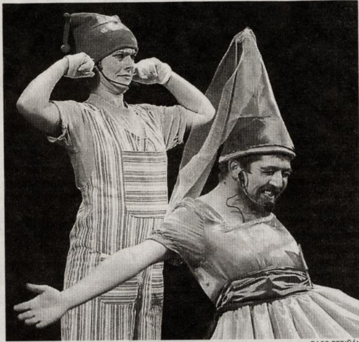
DIVERSION. Un instante de la representación

La semana que viene, concretamente los días 11 y 12, les tocará el turno a los alumnos de segundo de Secundaria, a los que, por medio de la obra teatral "Yeni va al Tuto", se les intentará inculcar la importancia de la asistencia al colegio, exaltando todos los aspectos positivos.